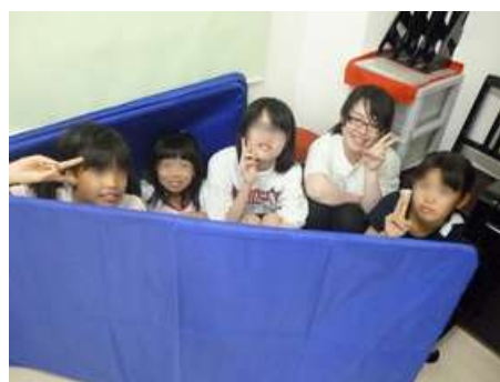
こっちはかくれんぼを...