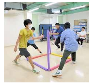
「せーの!」でキャッチ