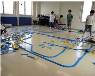
もはや名物となったプラレール祭り