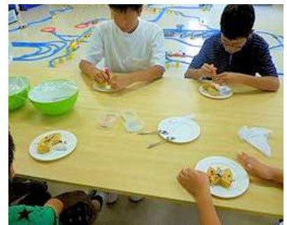
それでもおなかはすくのです