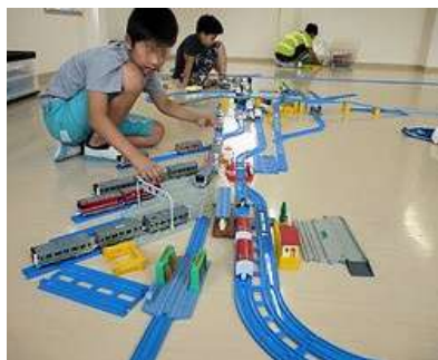
これだけ広いレイアウトも自由自在

の様子を写真を交えてお伝えします。 それぞれのグループで、普段行っている活動に加えて、工作、おやつ作り、花火、レクリエーションなどをして過ごします。スポーツ教室・将棋クラブと中高生卓球教室の2グループは、初めてカラオケにも行きました。今回はその時の様子