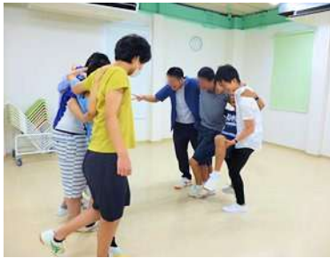
互いを支えあいながらのゲームです

※SSTゲームとは 社会的スキルトレーニングをゲーム感覚で行うもの。今回は主に協調スキルを取り上げて、チームで協力する大切さについて面白く学びました。勝ち負けのこだわりが強いと実施が難しいことがありますが、さすがは中高生たちでした。