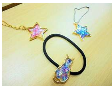
オリジナルのアクセサリーができました