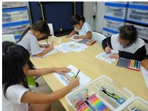
女子はぬりえに集中してます