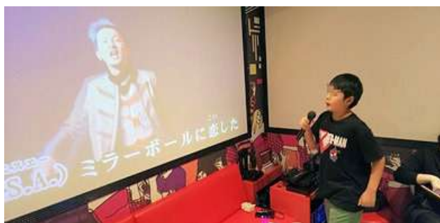
ノリノリで熱唱です

猛暑の中、外に出るのは何かと気を遣いますが、カラオケだと、涼しくて飲み放題なので、心配もなく快適に過ごすことができました。(ジュースを飲み過ぎてお腹を壊さないように気を付けたぐらいですかね(笑))